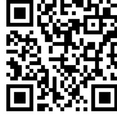
Retrouvez l'intégralité du texte en ligne sur Coop-ICEM

Roland Goigoux Professeur des universités à Clermont-Ferrand