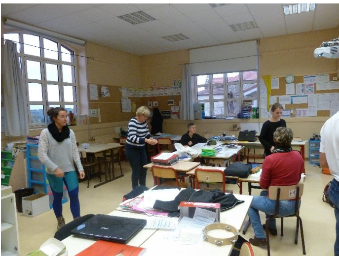
Les collègues autour de l'îlot central