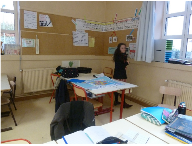
Ilots excentrés pour permettre les travaux de groupe