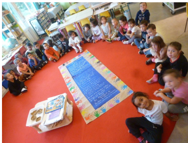
La grande lettre pour les correspondants

Les enfants de la classe de Céline et Laurence de La Luçquère