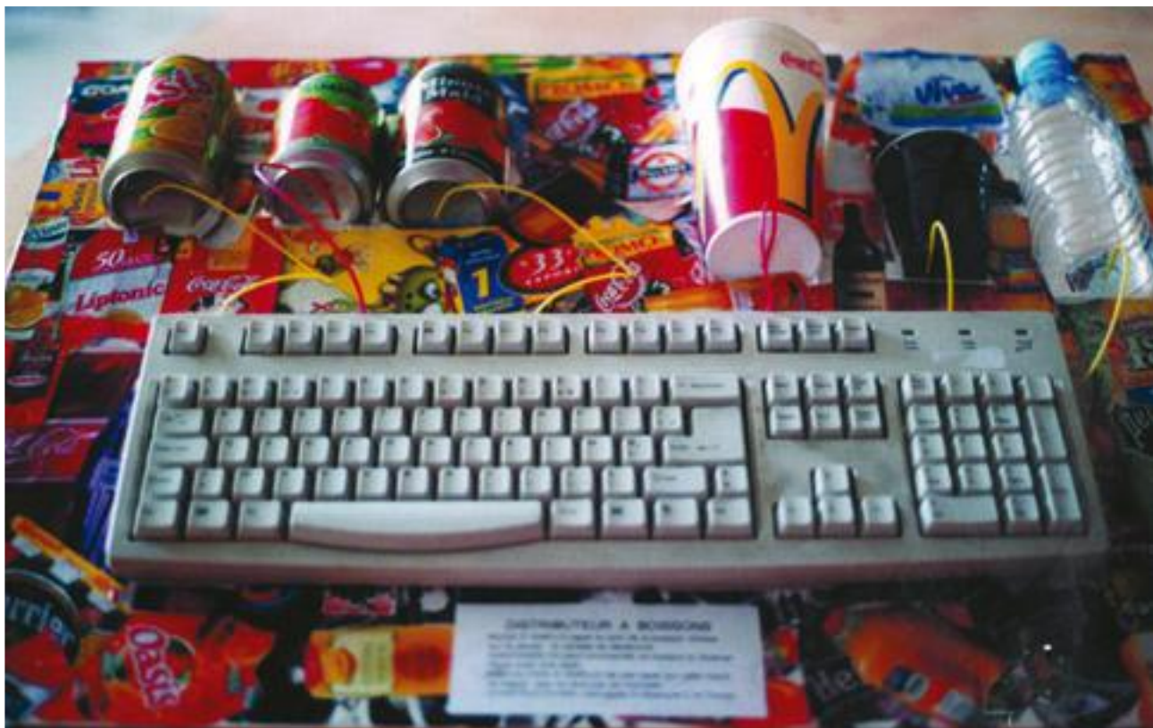
Distributeur de boissons