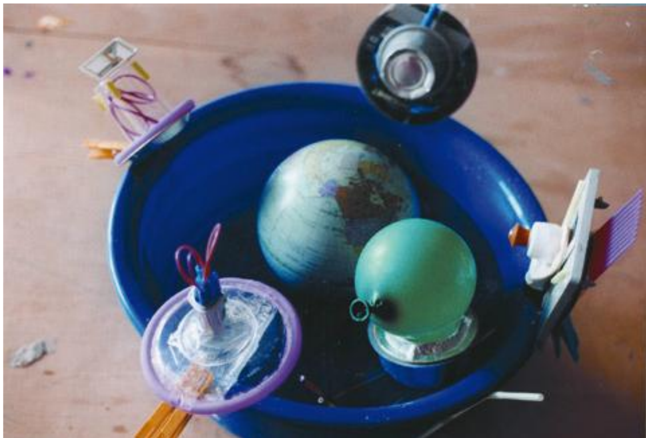
Machine à faire le tour du monde en trois souffles