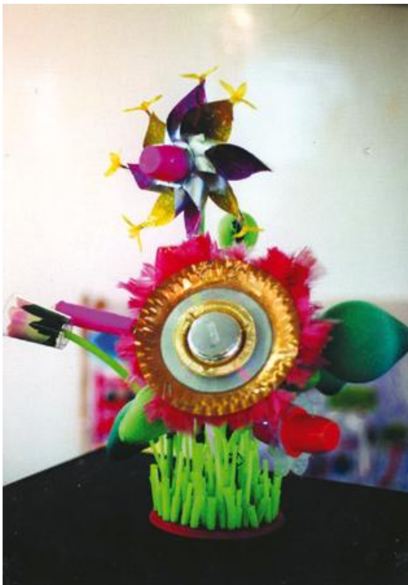
Moulin de jardin

En Juin 2002, à l'occasion d'un colloque - événement Arts plastiques organisé par l'Académie de Créteil pour les collèges et les lycées, autour du thème « Références/Référenciation », les élèves ont été sollicités pour proposer une production plastique en deux ou trois dimensions, qui articulerait matériellement deux ou trois éléments entre eux.