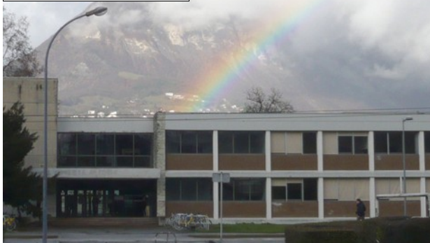
PHITEM Côté sud

Bohec étaient d'accord sur ce point : Si nos idées n'étaient valables que pour la pédagogie, elles seraient vite condamnées.