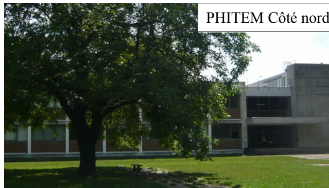
PHITEM Côté nord

En attendant, pour nous contacter : frem-ce@icem-freinet.net