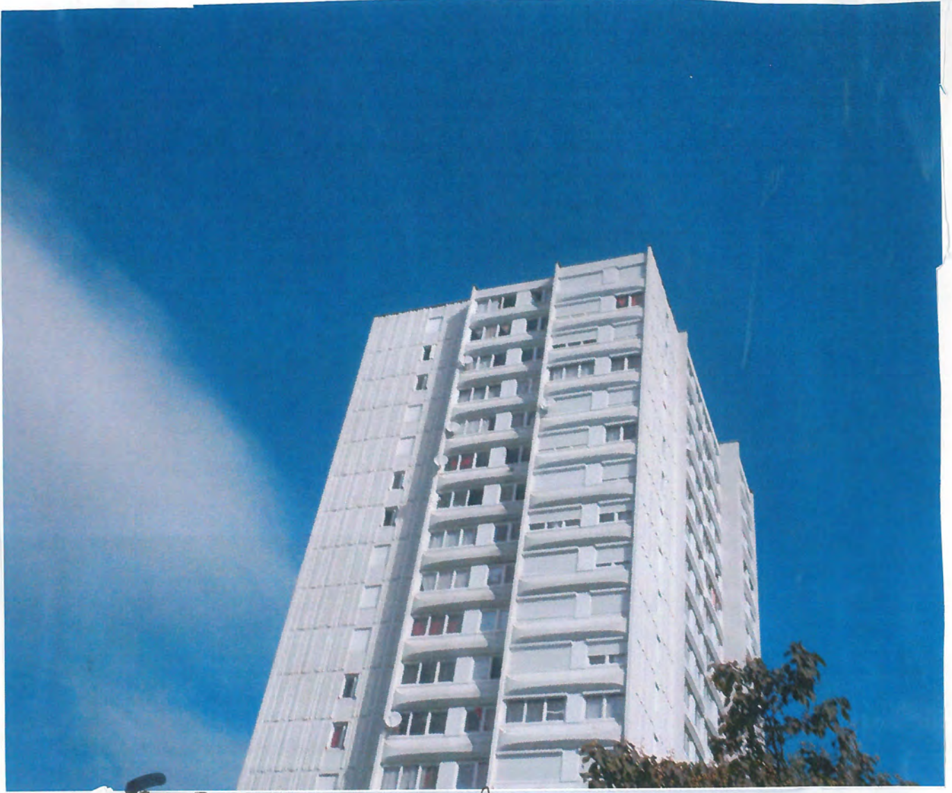
5 Bobigny, les immeuble