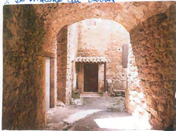
Panne archees de sud 16