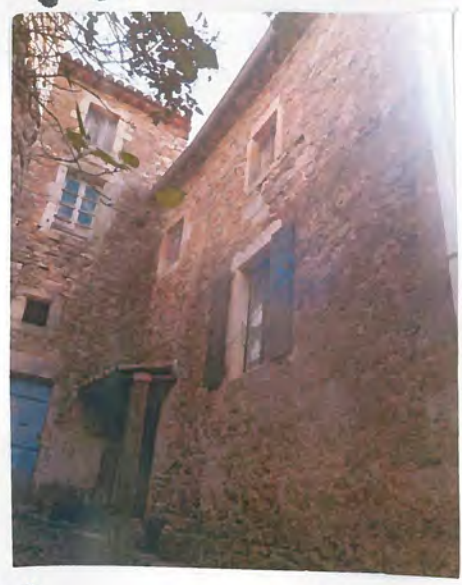
Panne archees du sud 118