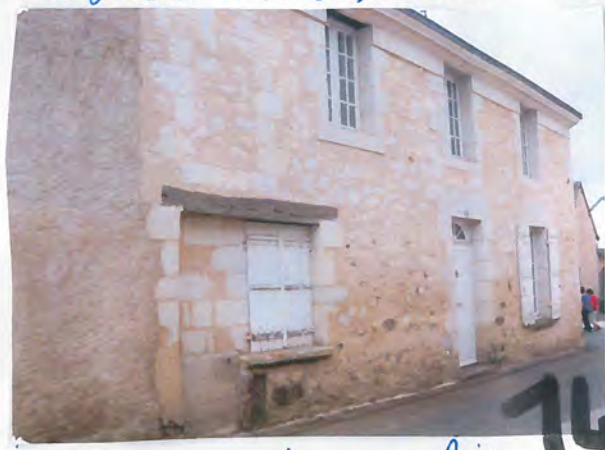
Sormaise maine et loire 14