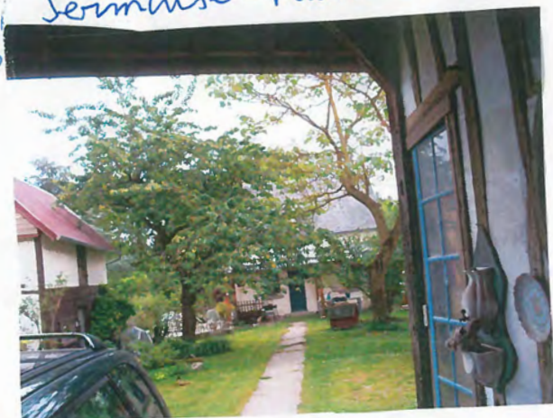
10 | Oise