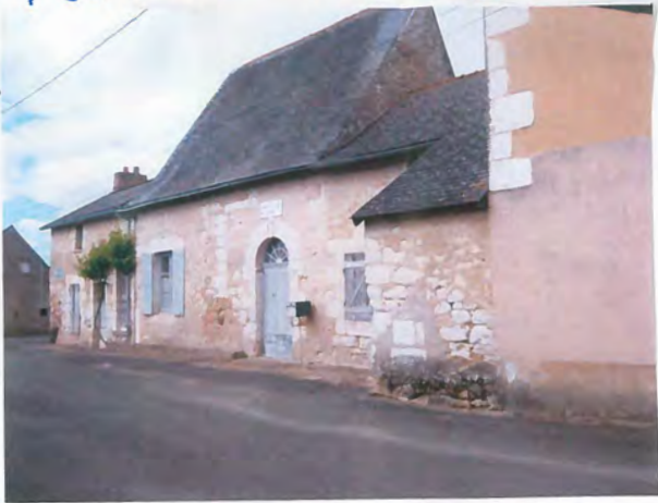
8 | Sormaise - Maine et Loire