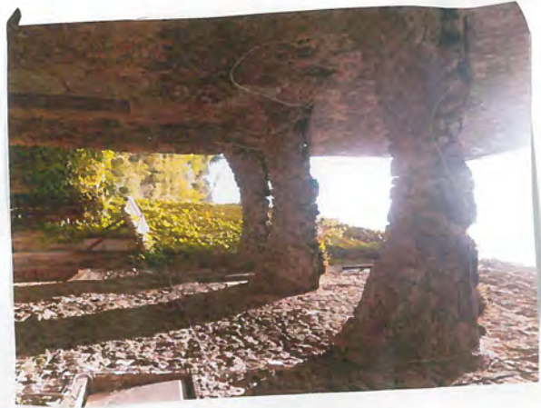
17, Panne archees du sud