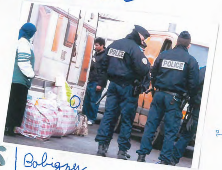
25 | Bobigny