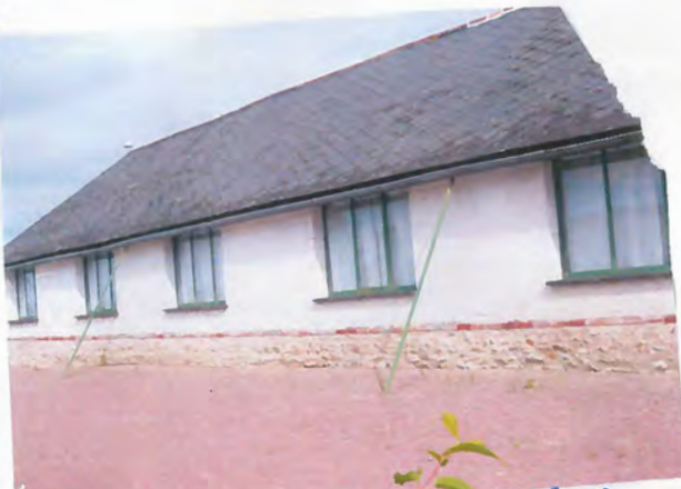
9 | Sormaise - Maine et Loire