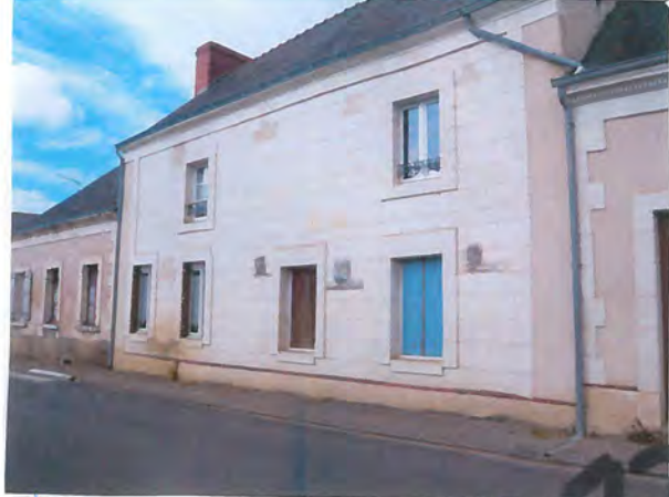
Sormaise maine et loire 13