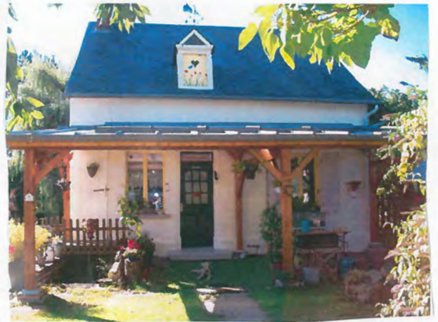
12 | Oise