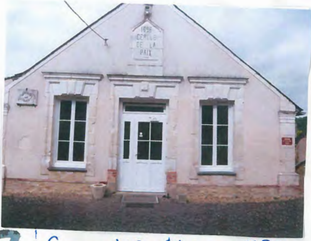
7 | Sormaise - Maine et Loire