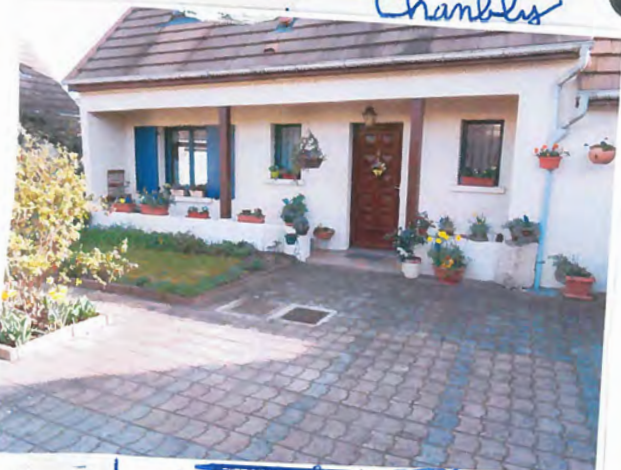
Chambly Chambly 23