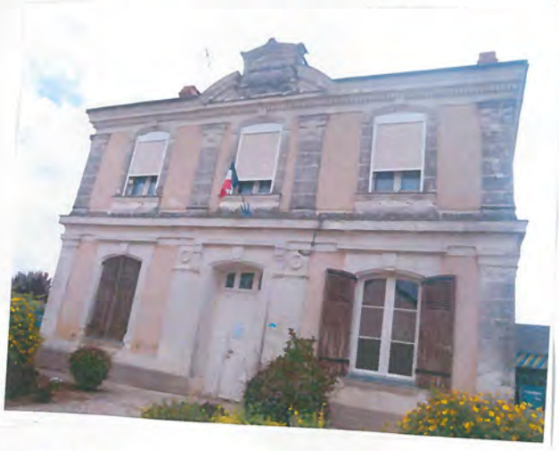
19 Sormaise - Maine et Loire