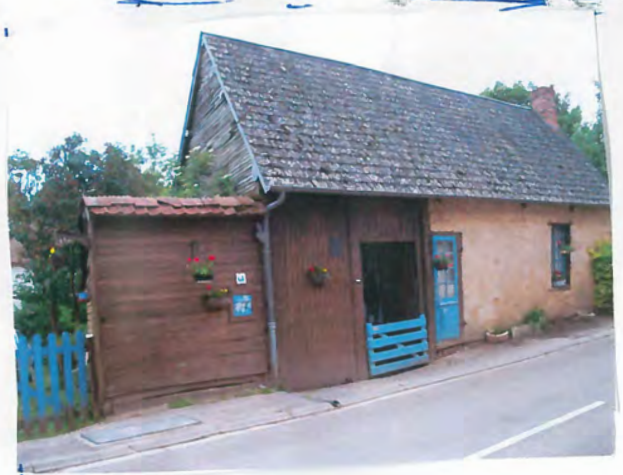
11 | Oise