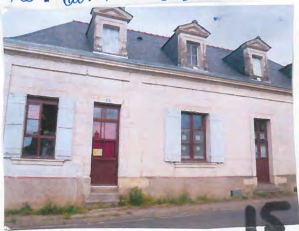
Sormaise du sud 15