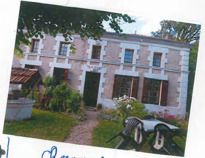
24 | Charente