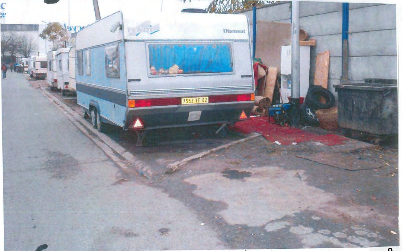
6 Bobigny, les caravanes des Roms