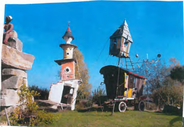
Bobigny Bobigny 20