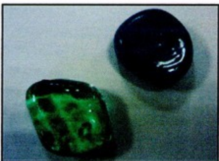
Les pierres bleues de Shemssy