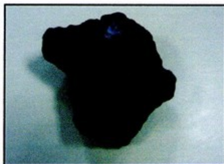
Une pierre de volcan, noire avec des traces blanches

Les pierres bleues de Shemssy ne sont pas vraiment des pierres. Il y a une rayure sur celle qui est opaque. On dirait dessous qu'il y a un caillou blanc, de la poterie ou de la pâte à sel et que le bleu est de la peinture. L'autre pierre est translucide : elle laisse passer la lumière. C'est peut-être du verre ou du plastique très dur. Elle les a achetées dans un magasin.