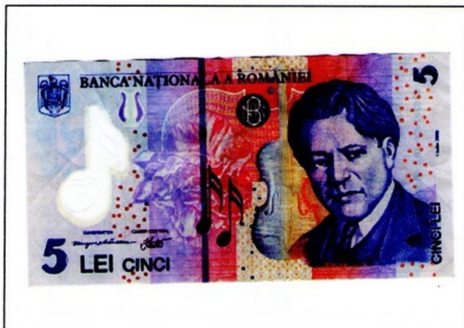
Un billet roumain de 5 lei, la monnaie de la Roumanie. On peut aussi payer en euros.