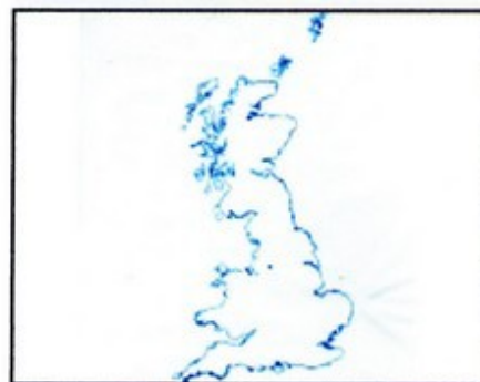
Le royaume uni . Le petit point, c'est Manchester.