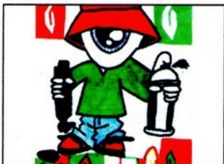
Un cyclope graffeur