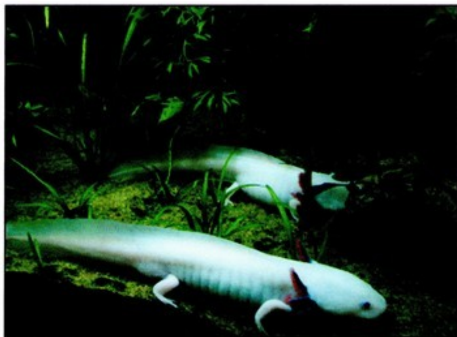
© Wikipédia ZeWrestler Mars 2010 Larves d'axolotl leucistique