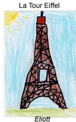
La Tour Eiffel

Tower Bridge est en Angleterre à Londres. A côté il y a un immeuble qui s'appelle cornichon en anglais. Quand la Reine d'Angleterre arrive, on l'ouvre et on le ferme pour la saluer. Il s'ouvre pour laisser passer les bateaux. Big Ben se situe en Angleterre à Londres. En fait c'est la cloche qui s'appelle Big Ben. Seuls les Anglais peuvent y entrer. Lila