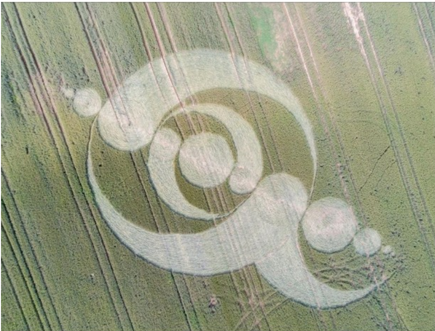
Ce crop circle est apparu dans un champ de blé de Sarraltroff en Moselle. Il est l'oeuvre de youtubeurs et non d'extraterrestres.

Pour les adeptes du paranormal, les crop circles qui apparaissent dans les champs de blé seraient l'œuvre d'aliens. Pour les sceptiques, ils seraient d'origine humaine. Pour trancher le débat, des youtubeurs ont réalisé une petite expérience instructive.