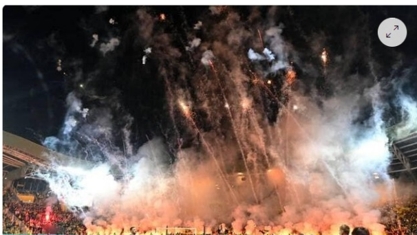
La tribune Loire sera fermée contre la Juventus Turin le 23 février prochain. | PHOTO : JÉRÔME FOUQUET / OUEST-ÉCLAIR

Gatien a commencé à travailler dans un bowling et il a appris que la tribune Loire serait fermée pour le match Nantes contre la Juventus. C'est une tribune réservée aux ultras. La fermeture est une sanction après des comportements dangereux (fumigènes, feux d'artifice). Ce n'est pas pour des raisons d'extrémisme politique.