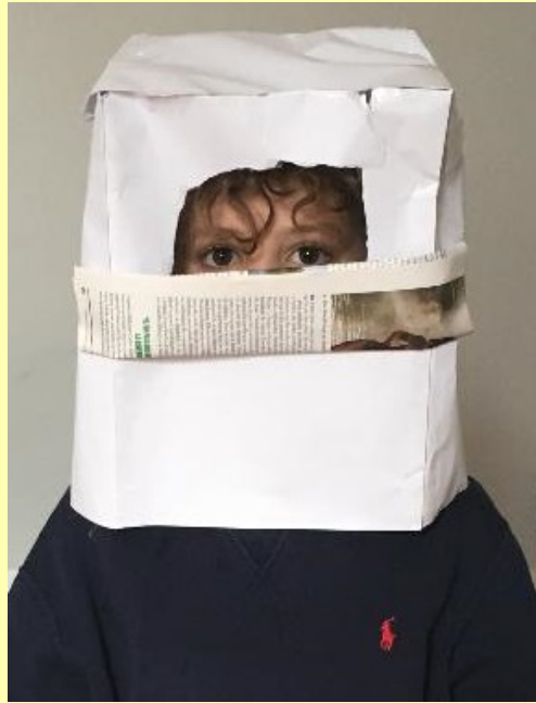
Le casque contre le corona