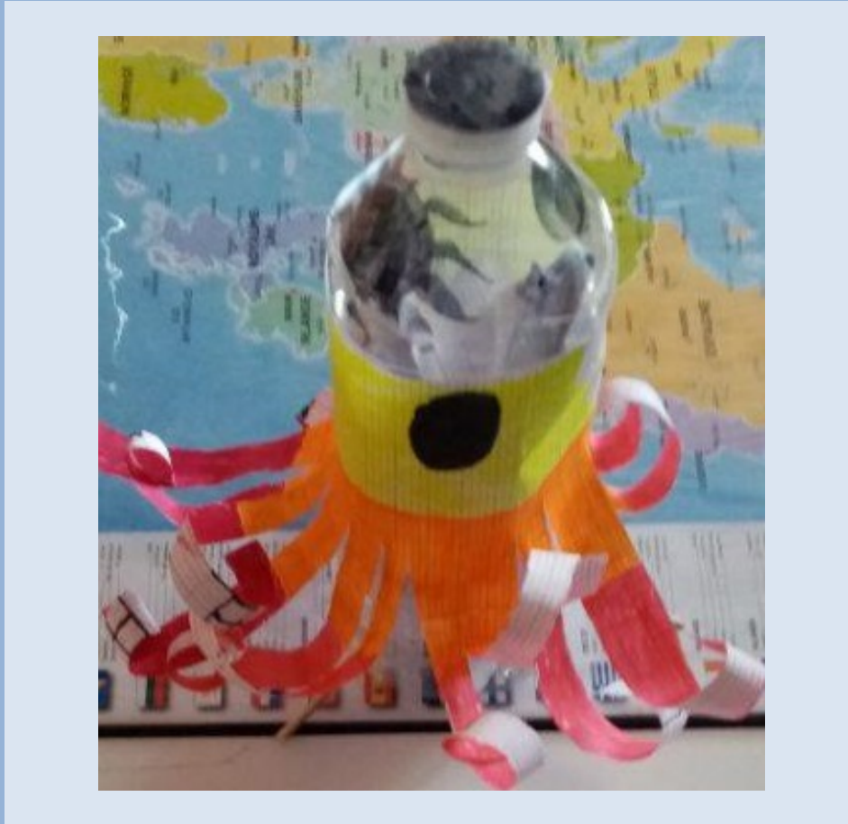
La fusée d'Emilio