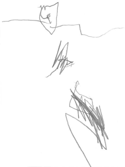
Ma mamm an hini eo