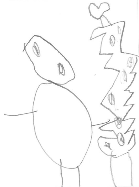
Ur boulom a ra Nedeleg