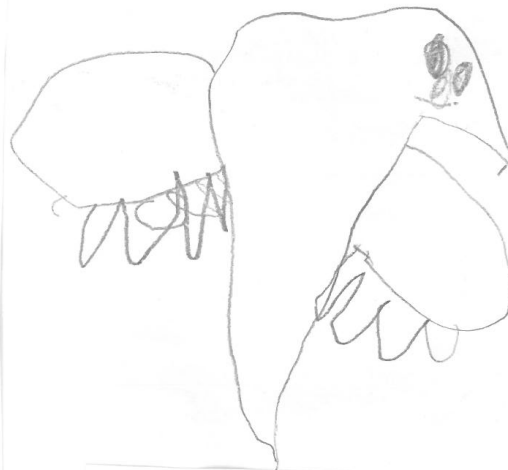
Ur peroked eo ha skuizh marv eo.

C'est une fusée dans l'espace. Elisa 5a 10m