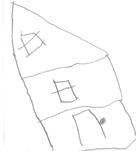
Ti ar gorrigeo eo, kousk a rant.

La maison des lutins, ils dorment. Lison 3a 9m