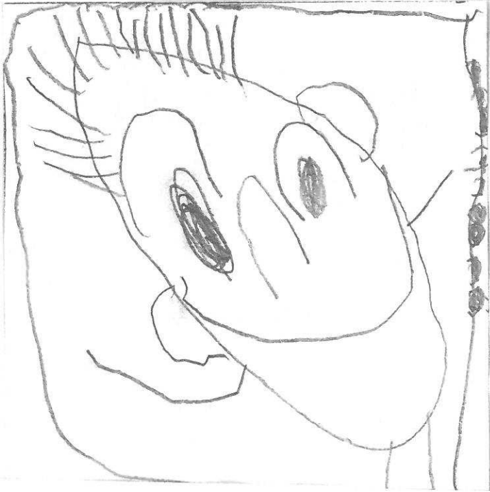
Mont a ra da labourat ha girlandennoù a zo gantañ.