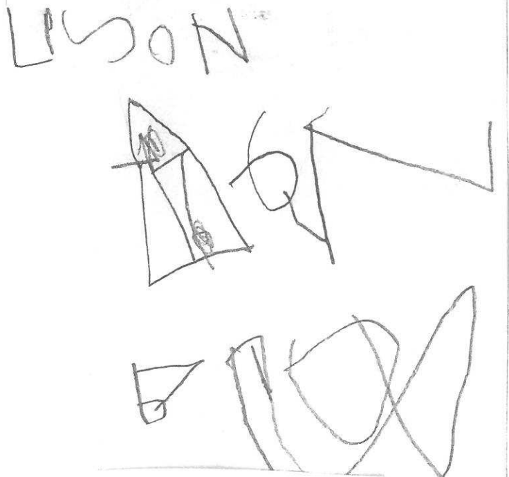
Un ti eo.

C'est papa qui fait sa douche. Elyna 3a 11m