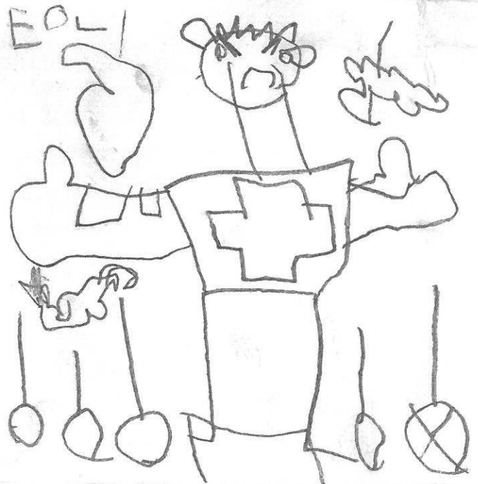
Labour get an trapez