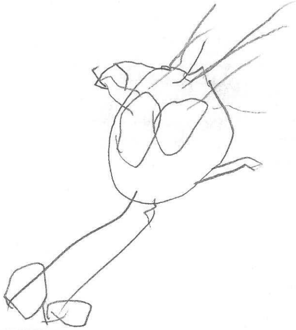
Ma mamm eo ha azezañ a ra evit sellet doh ar skinwell.