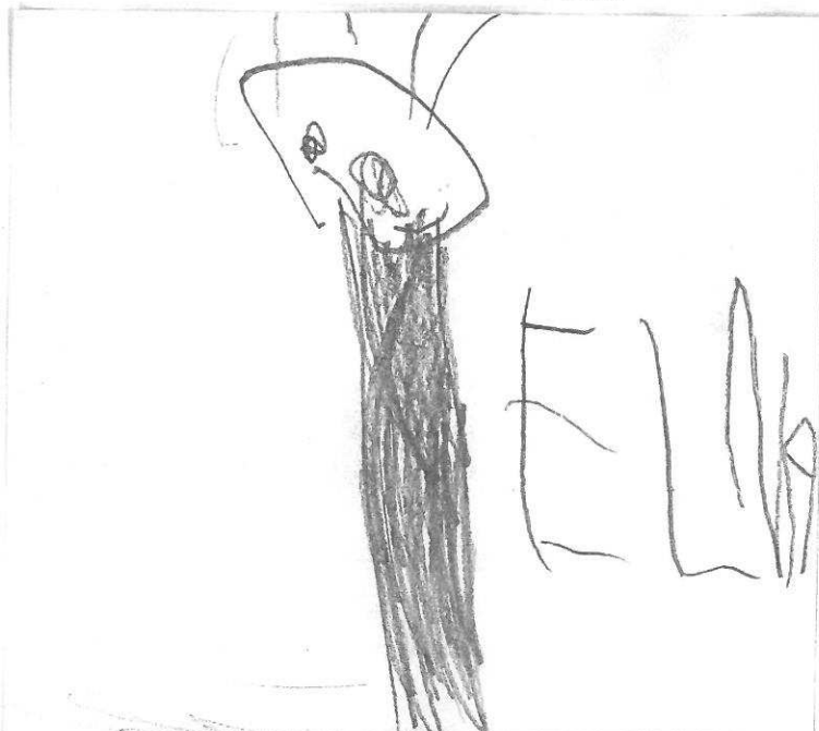
Kemer a ra ma zad ur strinkadenn.