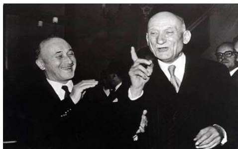
Robert Schuman (à droite) avec Jean Monnet

Pour accélérer ce développement, il défend l'idée d'un rapprochement franco-allemand.