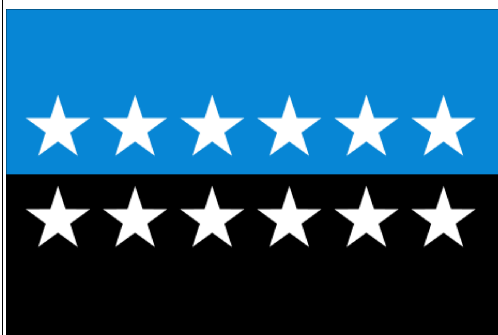
Drapeau de la CECA

*supranationale : au-dessus des nations.