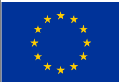
Drapeau de la CEE et de l'UE

** Droits de douane : taxes à payer pour passer des marchandises à une frontière.