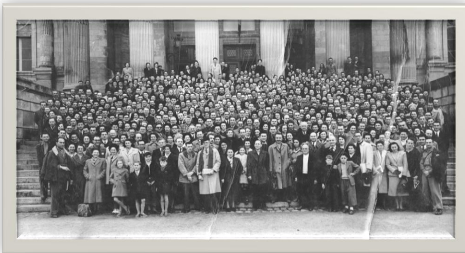
Congrès ICEM d'Angers 1949

Les outils pédagogiques et les publications de l'ICEM