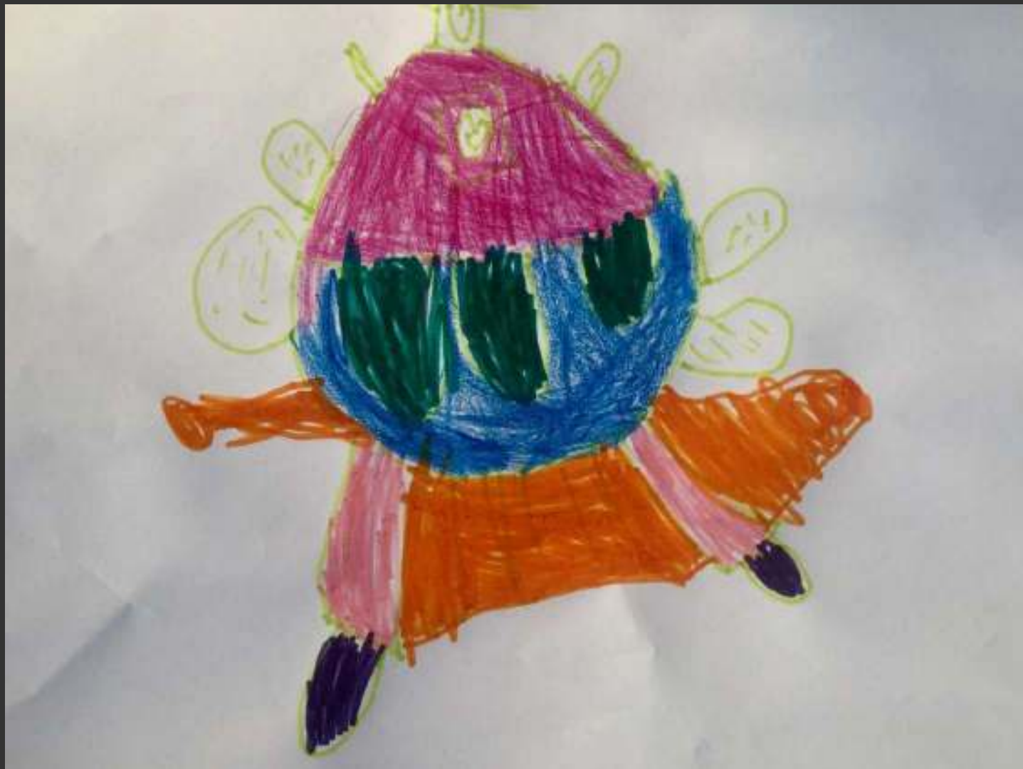
Un homme planète. Leila, 4a9m