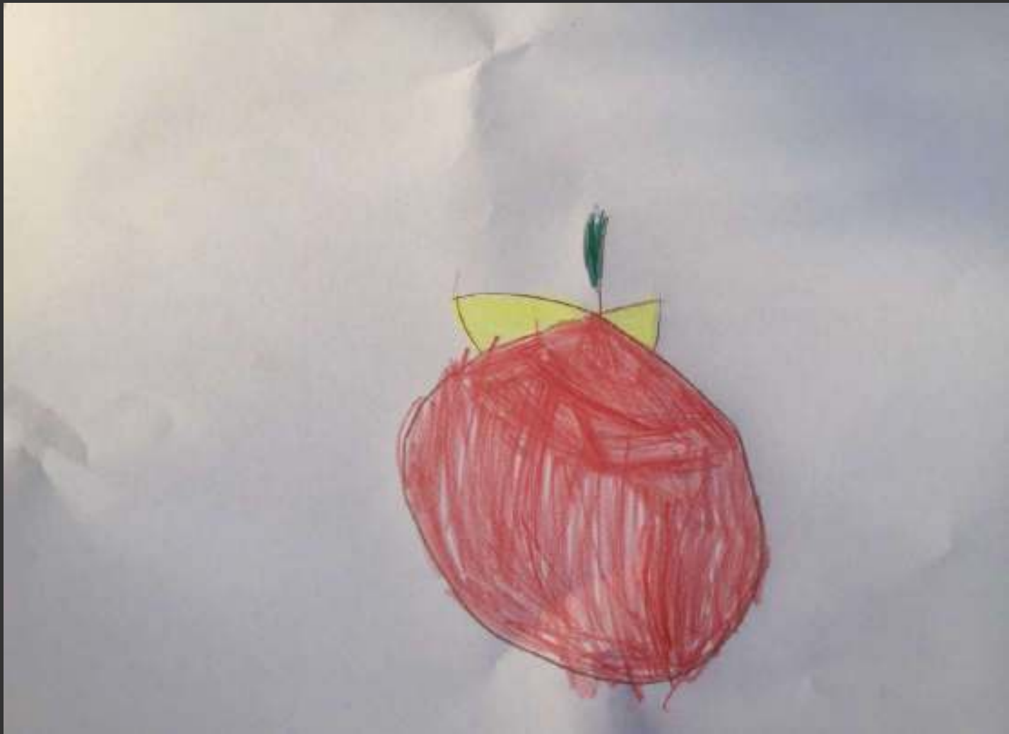
Une pomme. Leïla, 4a9m