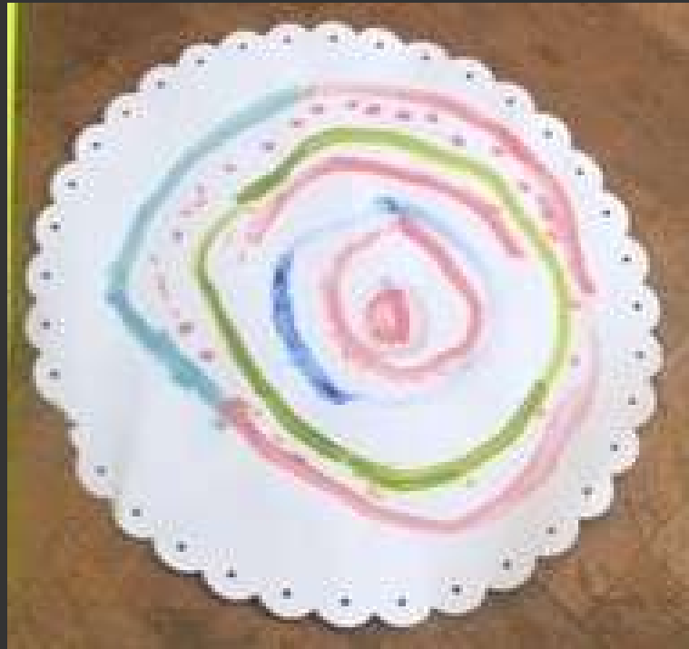
Une mer géante avec tous les poissons.