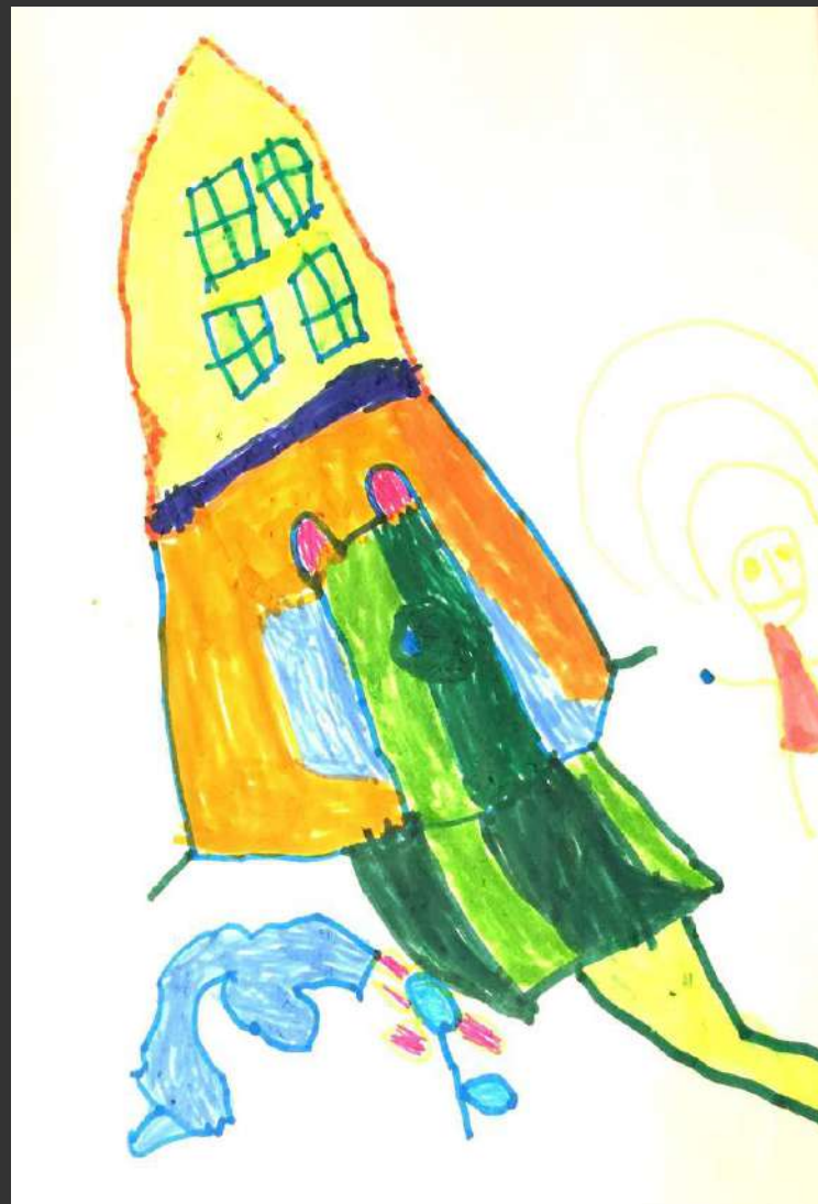
Une maison avec une porte ours, un chemin. Leila, 4 ans 9 mois