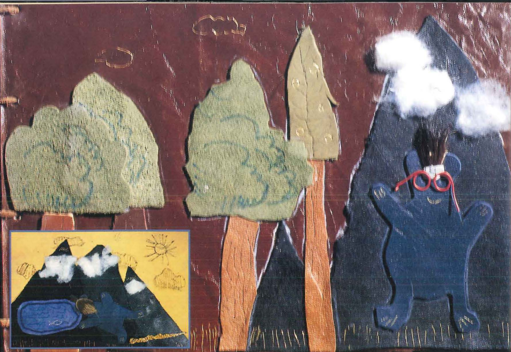
L'Ours bleu - classe de GS et de CP de l'école de Sainte-Flaive-des-Loups.