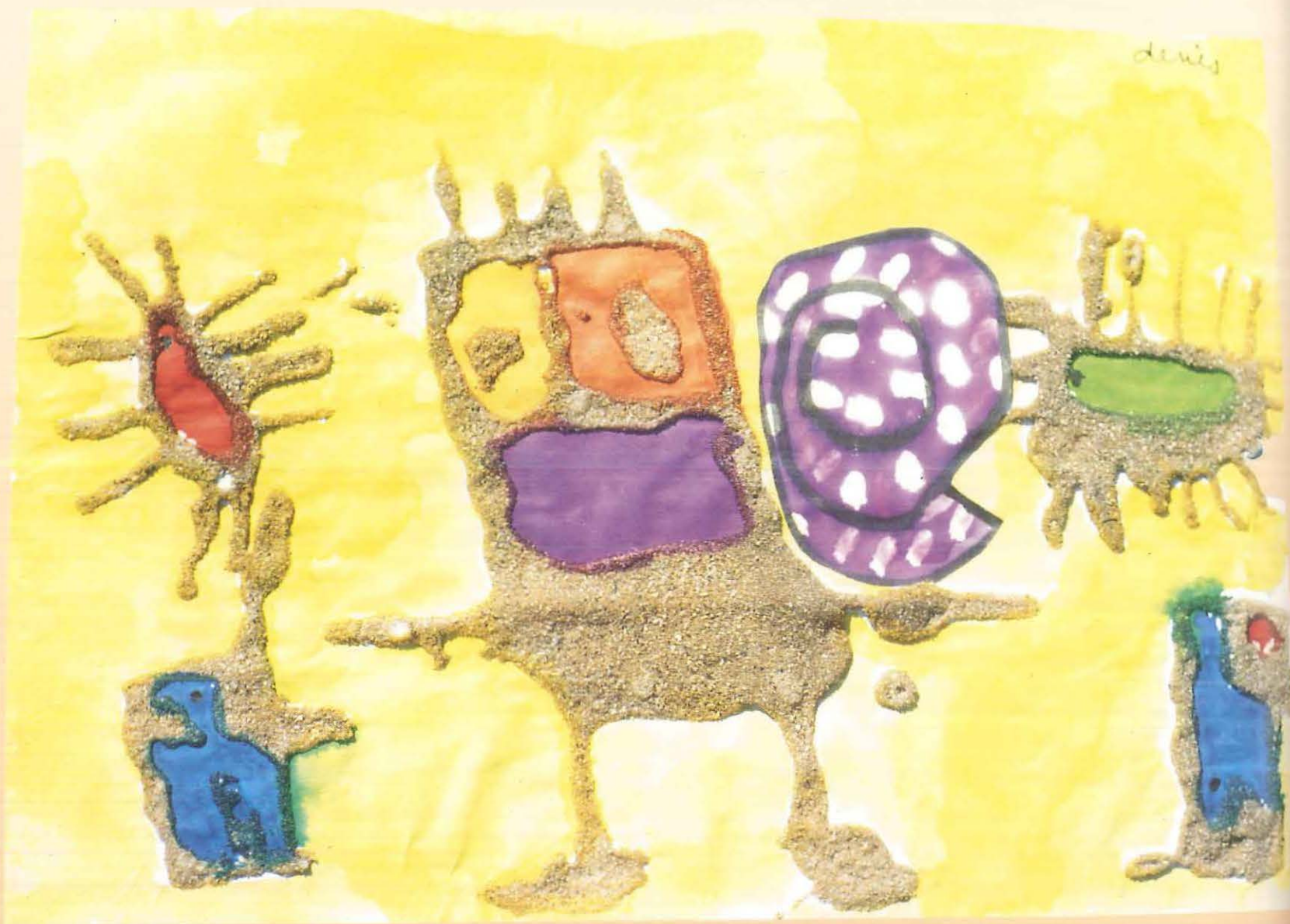
Le quatrième pirate est tout jaune. Il a très mal au bout du nez. (Travail à la colle et au sable). A découvrir les yeux fermés...