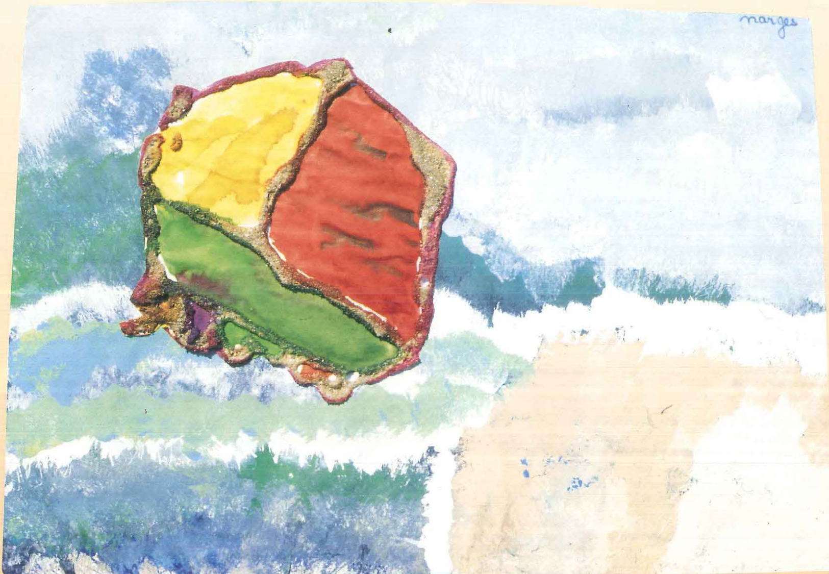
Les poissons volants volent au-dessus de l'eau. On dirait qu'ils dansent. (Technique du monotype).