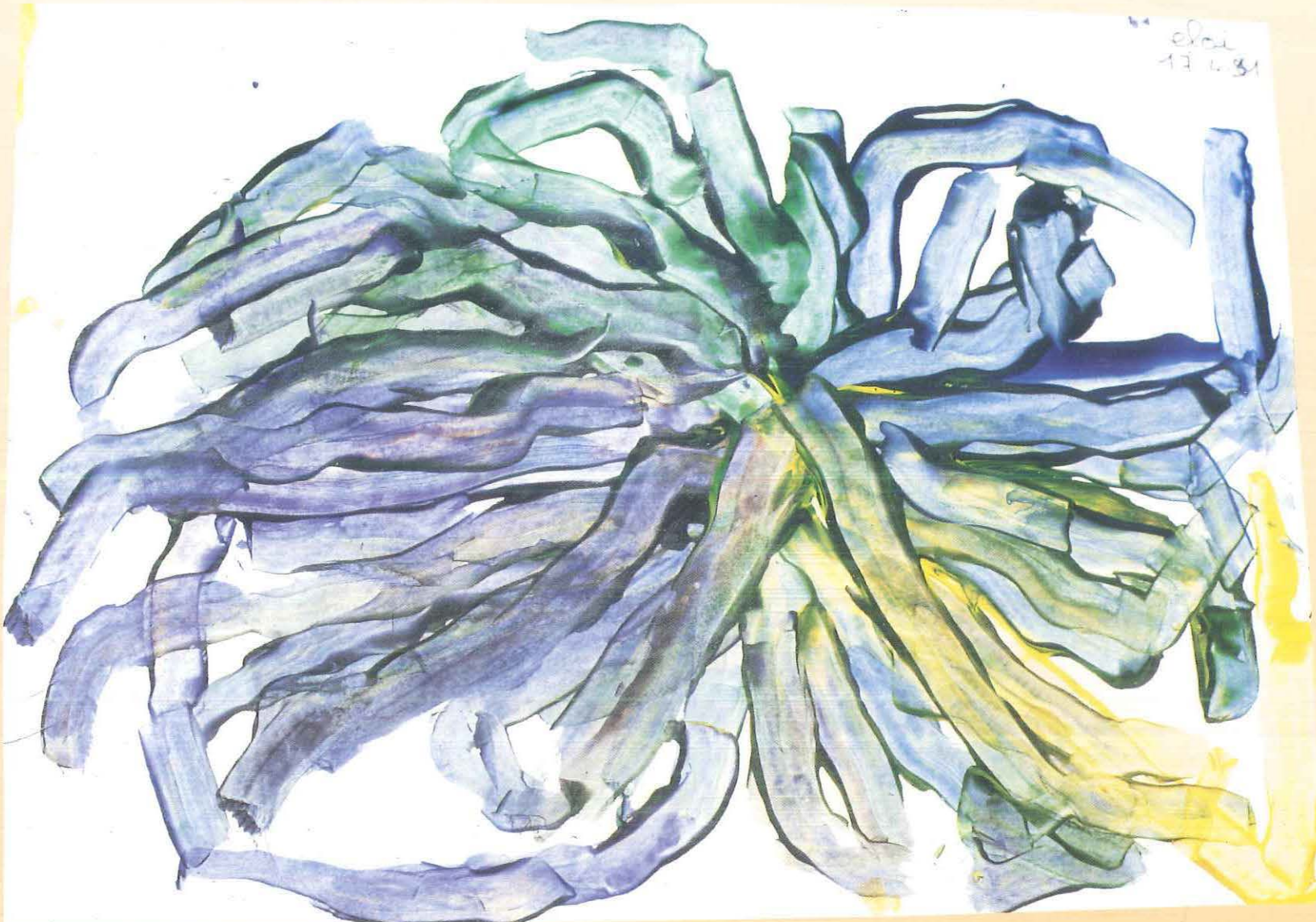
Une pieuvre géante entre dans la grotte. Elle a beaucoup de bras. Elle est de toutes les couleurs (Travail au kromar).