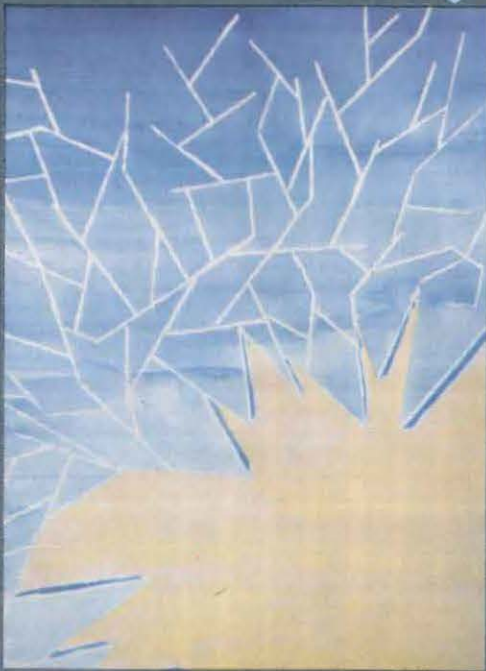
Les éclats de Katia