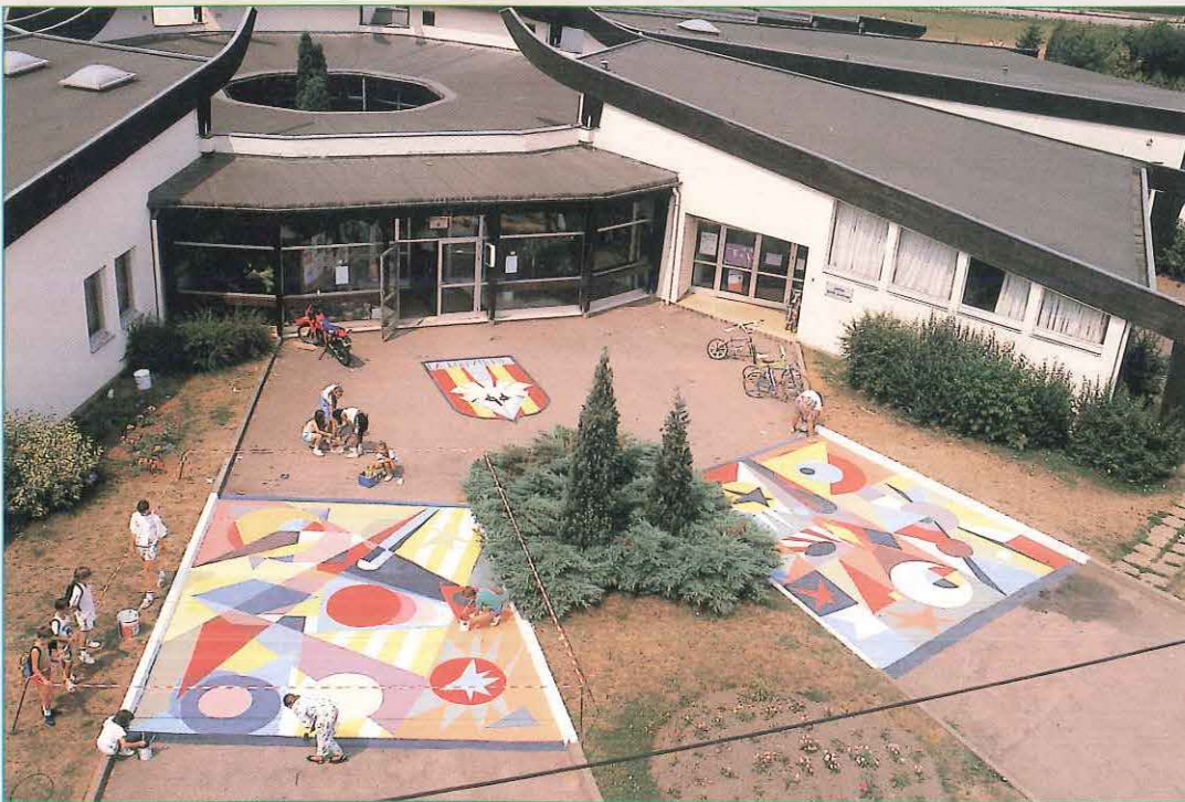
Maquette grandeur nature