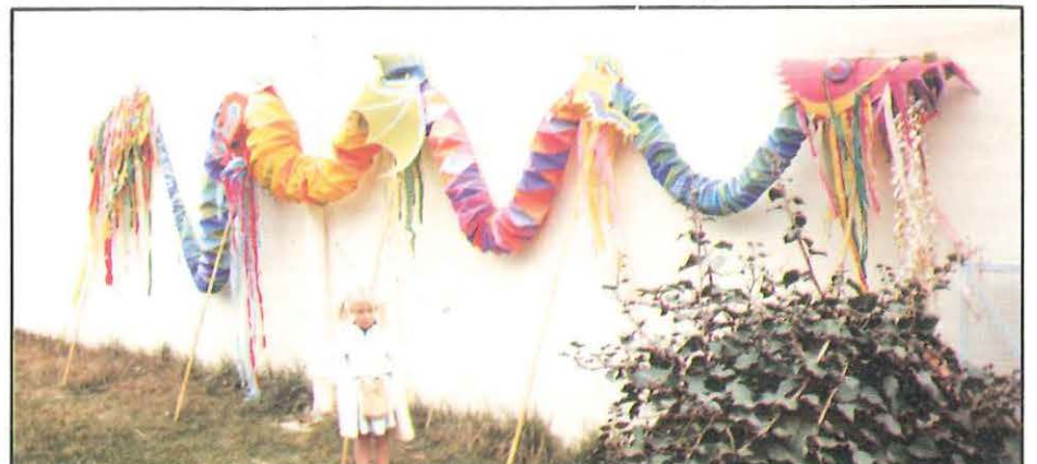
Dragon en papier sur échasses