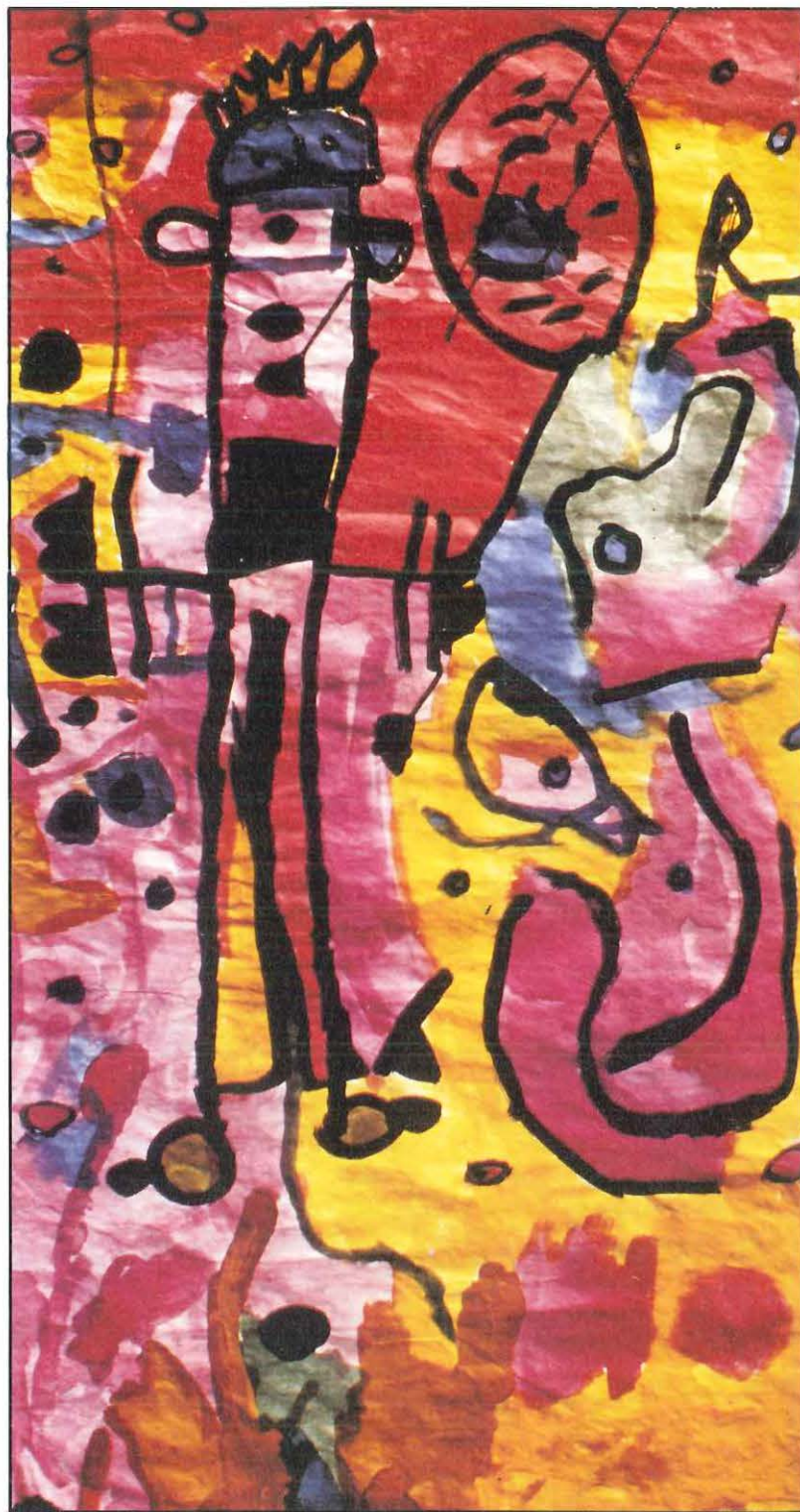
Encres - École d'Albias

Cours moyen Saint-Antoine-de-Breuilh 24 - Dordogne