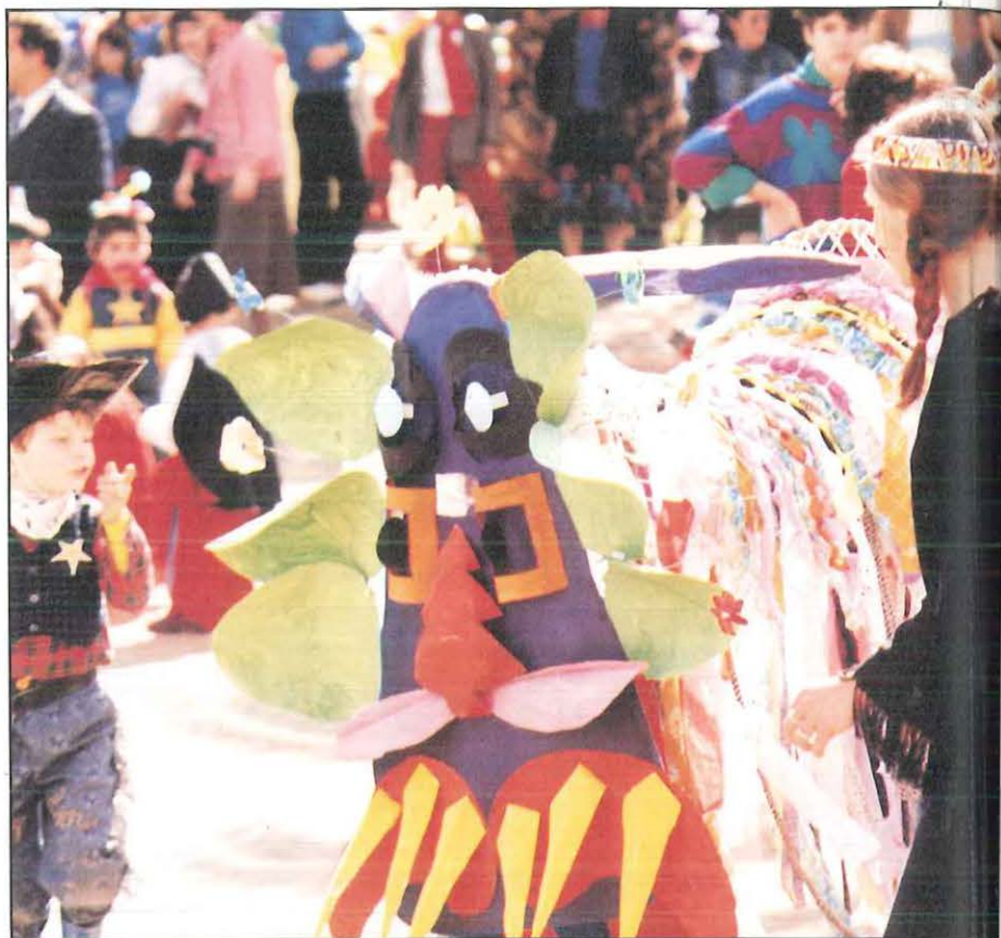
Carnaval, c'est la fête !

Pour une manipulation facile, chaque cerceau est cloué au tableau (une section à la fois). Le tissage se fait avec des bandes de tissu de 1,50 m minimum. C'est facile, même avec les petits : une bande dessus, dessous, dessus... La suivante dessous, dessus... Pour plus de solidité, le tissu ayant tendance à glisser, il y a intérêt à faire un point de fixation pour chaque bande.