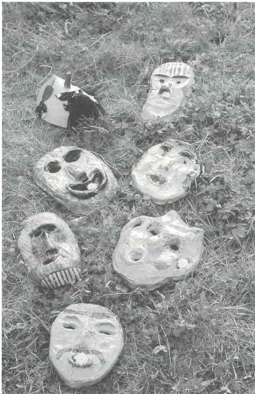
Masques en pâte à papier réalisés pour le montage audiovisuel (classe de 5 e )