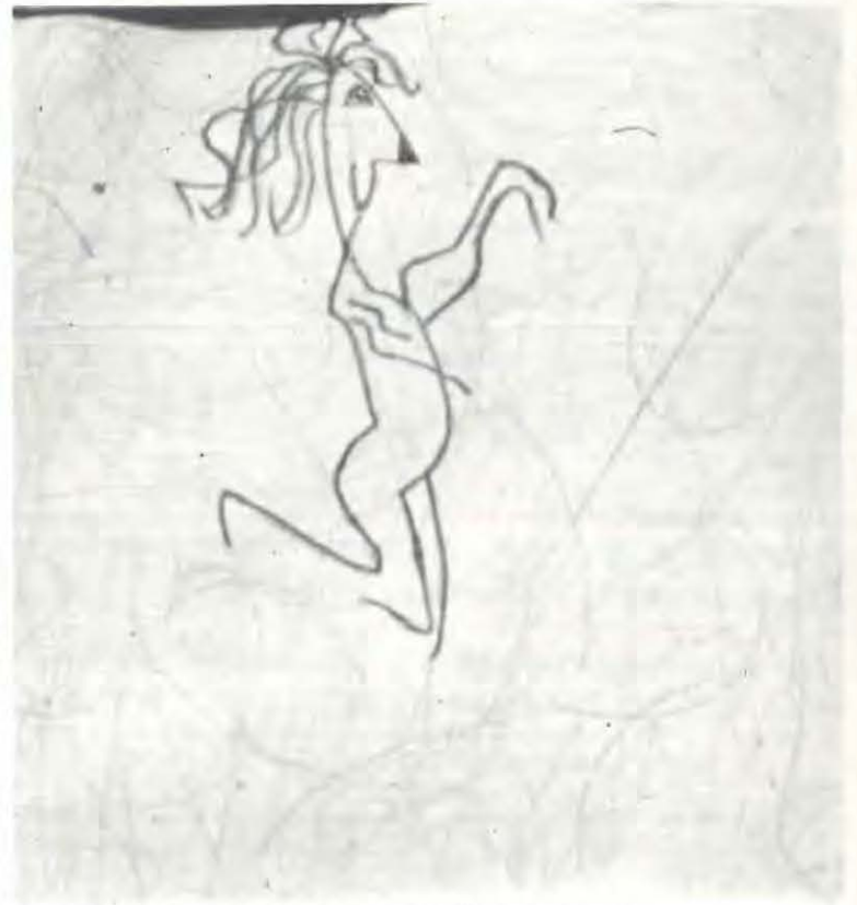
Un personnage se dégage du gribouillage de départ

Cinquième étape : Réalisation d'une fresque de 6 mètres de long sur 1 mètre de large. J'ai donné tous les dessins réalisés dans une classe de 5 e et une classe de 4 e C.P.P.N., à un groupe d'élèves d'une classe de 5 e . Ils ont choisi des personnages qu'ils ont reproduits à la craie sur un rouleau de papier Canson. Ils les ont ensuite exécutés à l'encre de Chine.