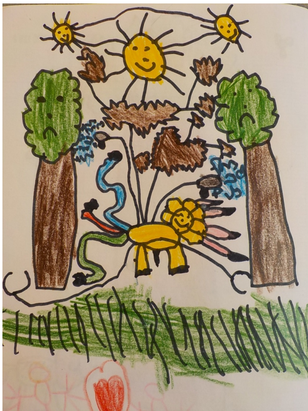
Les arbres ont peur. Un robot-tigre les attaque. Elouan