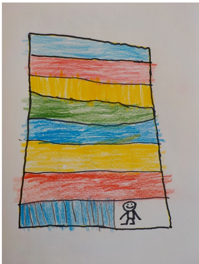
J'étais dans un immeuble il y avait plein de gens. J'étais intimidé. Neil