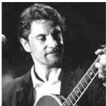
Francis Cabrel C'est écrit