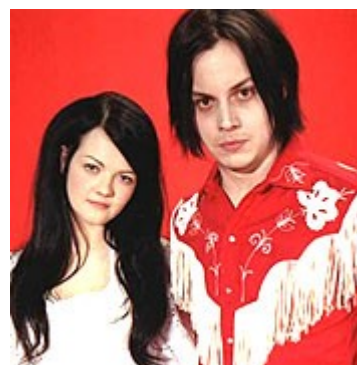
The White Stripes Hardest button to button