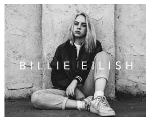
Billie Eilish, Bury a friend