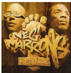
Neg Marrons, Le bilan