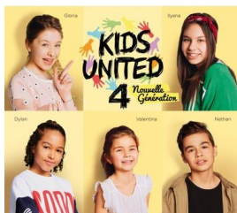
Kids United, On écrit sur les murs