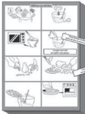
13 affiches préparation muette