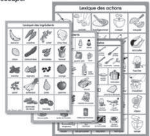
4 affiches lexiques (ingrédients, ustensiles, actions)