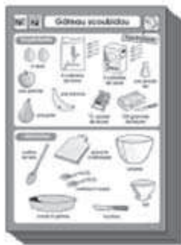
12 affiches ingrédients et ustensiles