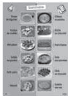
1 affiche sommaire