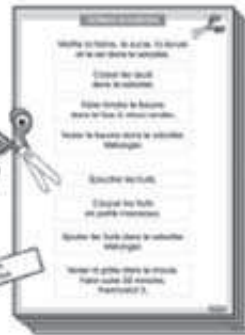
12 fiches étiquettes texte des recettes à découper