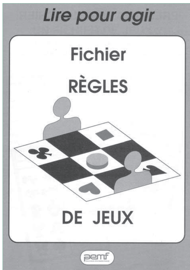
Livret Règles de jeux

« J'ai attribué une couleur à chaque fichier. Pour chaque série, les six fiches d'apprentissages sont placées dans une grande pochette en plastique. La fiche réponses (autocorrection) est dans une petite pochette scotchée sur la grande (fixée sur un seul côté pour permettre l'accès au verso). Chaque élève a dans son cahier de travail personnel le plan de travail individuel du fichier et une petite pochette en plastique dans laquelle il glisse la fiche qu'il emprunte.