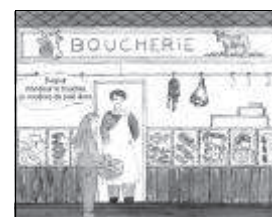
Quand on clique sur la petite fille, la bulle arrive. Pour vérifier sa lecture, l'enfant peut cliquer sur le texte pour l'entendre.