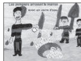
Souvent c'est d'abord l'action déclenchée qui confirme les hypothèses de lecture.