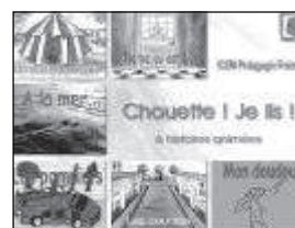
Le menu d'accueil de « Chouette ! Je lis ! » est sonore et permet d'aider au choix.