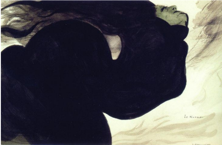
Le Nuage , Spilliaert, 1902

abstraction et figuration : mouvement des vagues, des cheveux masse noire énorme au milieu du tableau